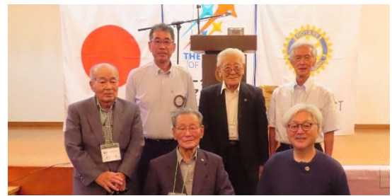
鹿屋プロバスクラブの皆様と会長・幹事