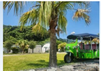
グランピング施設