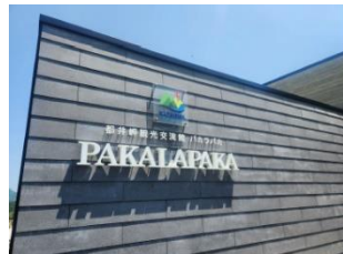
都井岬観光交流館 パカラパカ