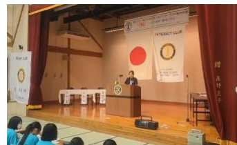
研修会 御崎馬についての講演