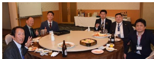
鹿屋高校長、米山奨学生・カウンセラー・会長以外の皆様